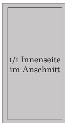
175 mm x 330 mm 990 Euro