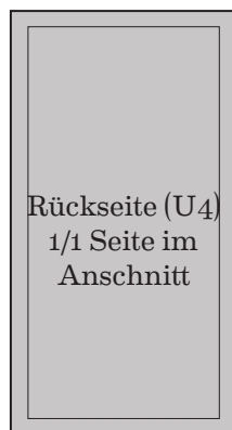
175 mm x 330 mm 1080 Euro

Alle Preise in Euro zzgl. 19% MwSt. Zwischenformate berechnen wir zum Preis der nächstgrößeren Anzeige.