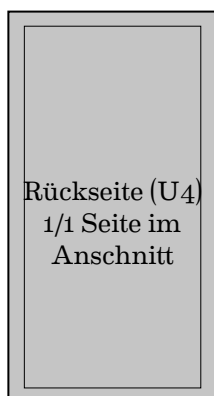
175 mm x 330 mm 1190 Euro

Alle Preise in Euro zzgl. 19% MwSt. Preis der nächstgrößeren Anzeige.