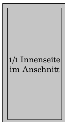
175 mm x 330 mm 1090 Euro