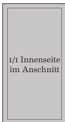
175 mm x 330 mm 1160 Euro zzgl. 19% MwSt.