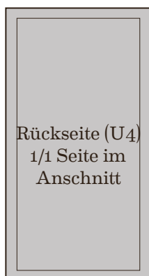
175 mm x 330 mm 1260 Euro zzgl. 19% MwSt.